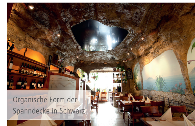
Organische Form der Spanndecke in Schwarz