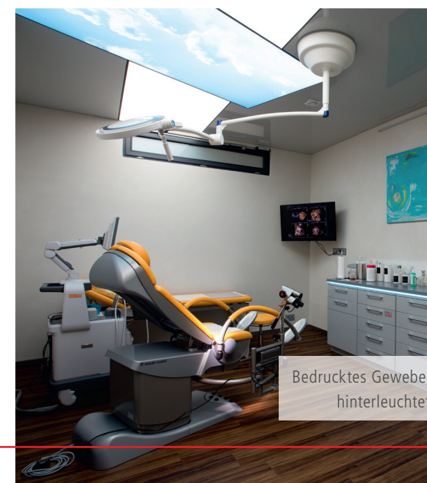
Bedrucktes Gewebe, hinterleuchtet